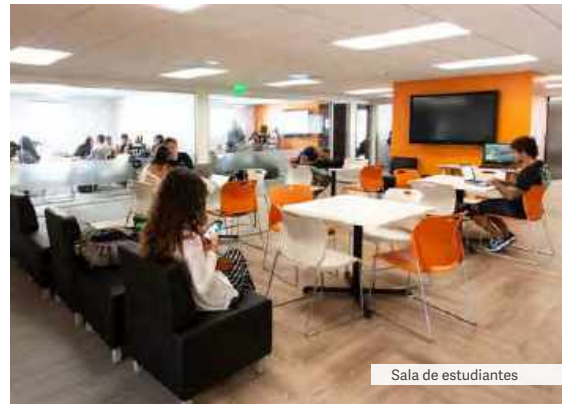
Sala de estudiantes

CASA DE FAMILIA estándar 🚗 APARTHOTEL confort 🚗, superior 🚗