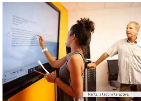
Pantalla táctil interactiva