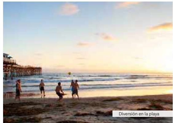
Diversión en la playa