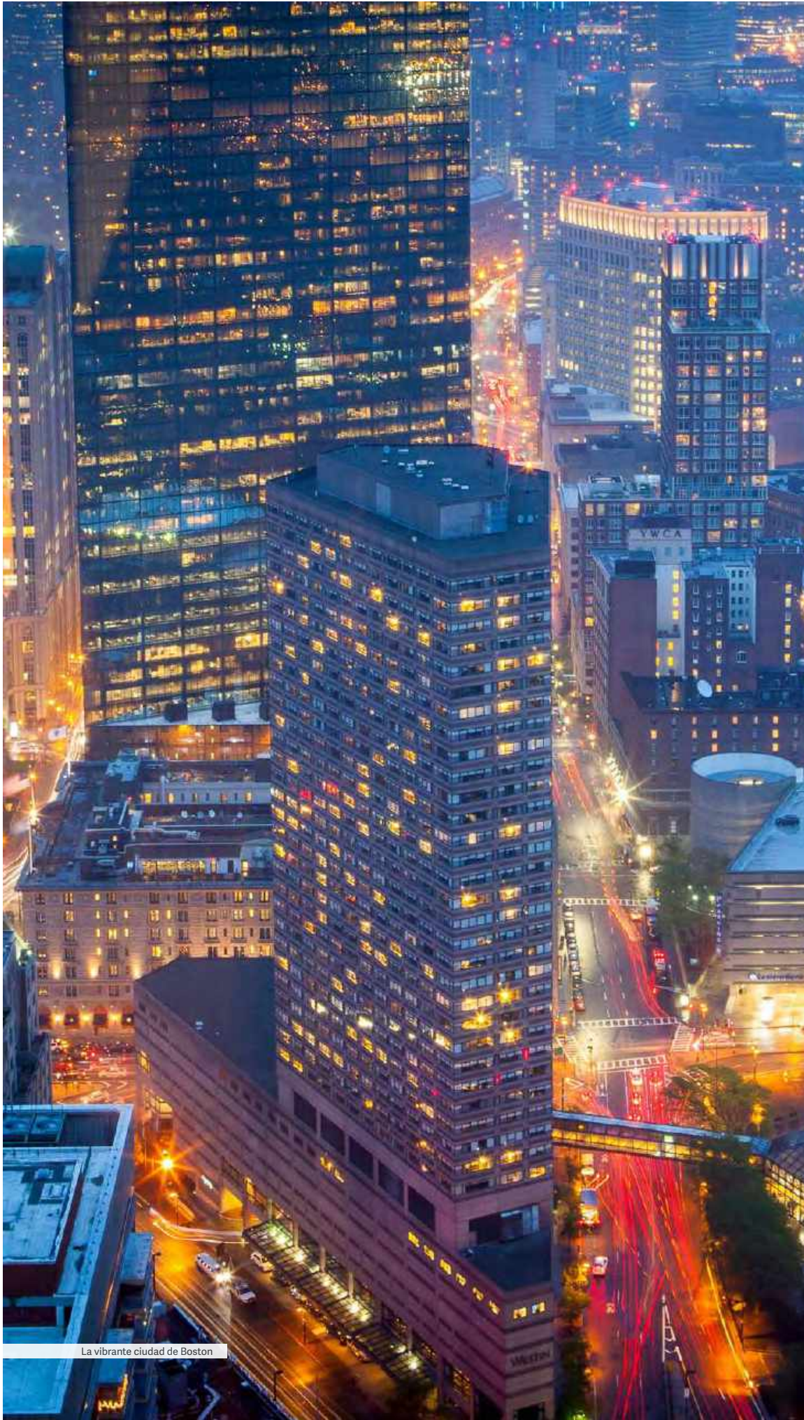
La vibrante ciudad de Boston