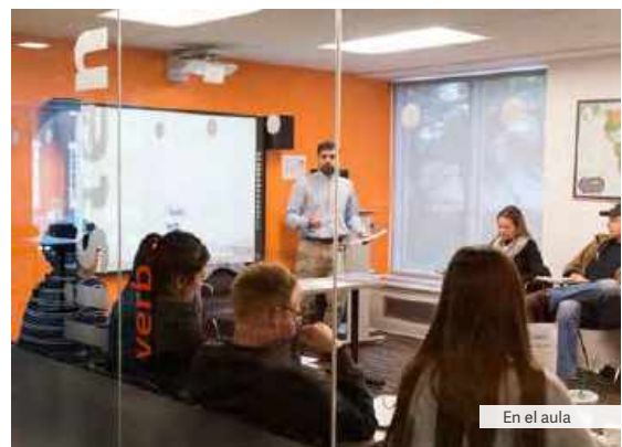
En el aula