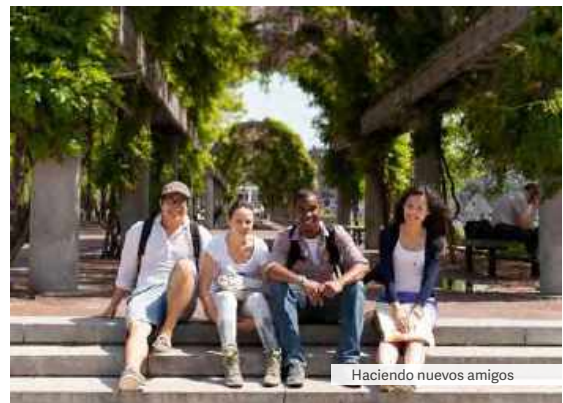
Haciendo nuevos amigos